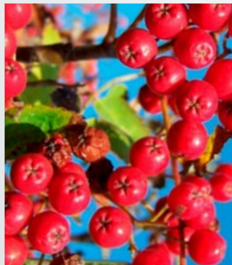
Portsa ry on lahjoittanut sata vuotta täyttäneille taloyhtiöille Suomenpihlajan istutettavaksi pihalle.

Lupaehtoihin edellytetään usein kaadettavan puun korvaamista uudella. Jatkuvilla istutuksilla turvataan, että Portsa säilyisi vihreänä tulevaisuudessakin.