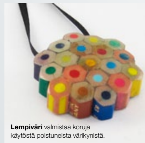
Lempiväri valmistaa koruja käytöstä poistuneista värikynistä.