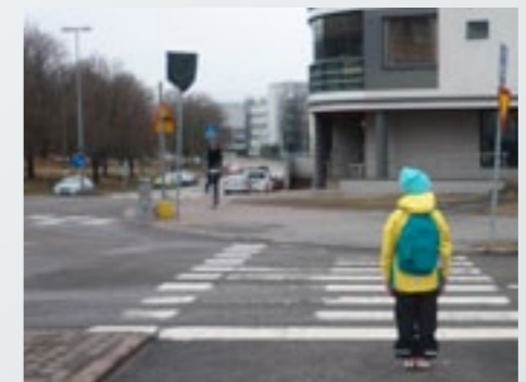
Liikennevalot tähän, kiitos!