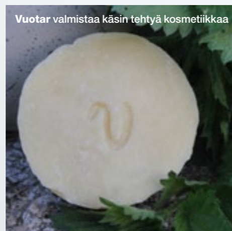
Vuotar valmistaa käsin tehtyä kosmetiikkaa