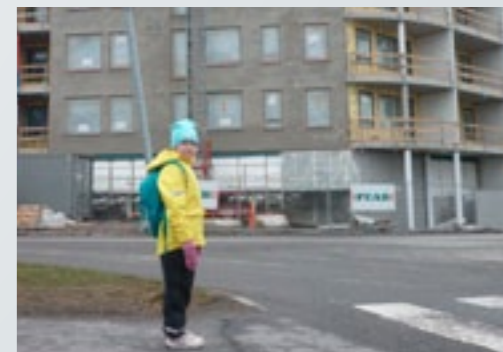
Puistorinteen Vilman koulumatkan vaarallisin risteys?