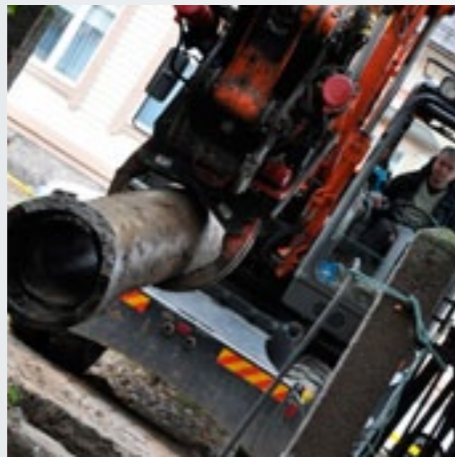
Vanha viemäriputki nousee kaivinkoneella kevyesti.