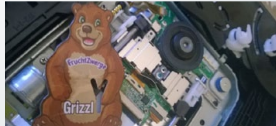
Pelikonsolin sisältä löytyi tällainen kaveri.