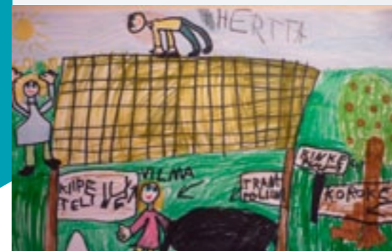
Unelmien koulutie näyttää tältä.

Mitähän kaupunkisuunnittelun ammattilaiset sanovat tähän? ■