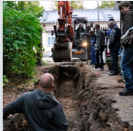
As Oy Puistorinne ihailee, kun koneurakoitsija Viherkoski toimii.