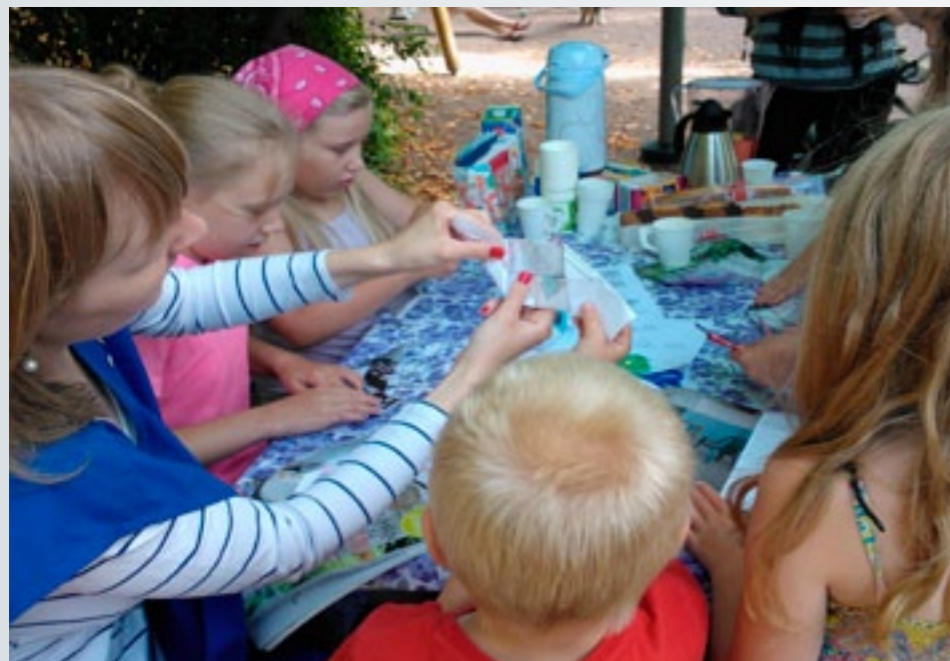
Paperitaittelu vaatii taitoa ja keskittymistä.

MLL Portsan yhdistyksen toimintaa voi seurata Facebookissa osoitteessa facebook.com/mllportsa ja nettisivuilla mll.fi/paikkaisyhdistykset/portsa . Yhteyden yhdistykseen saa sähköpostitse: elina.myllymaki@pp.inet.fi tai tulemalla juttusille tapahtumissa. ■