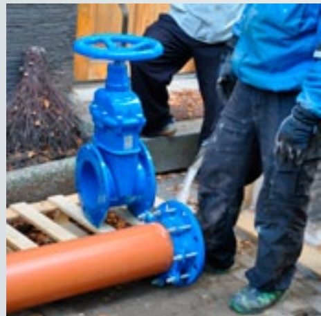
Tässä se on, patoventtiili.