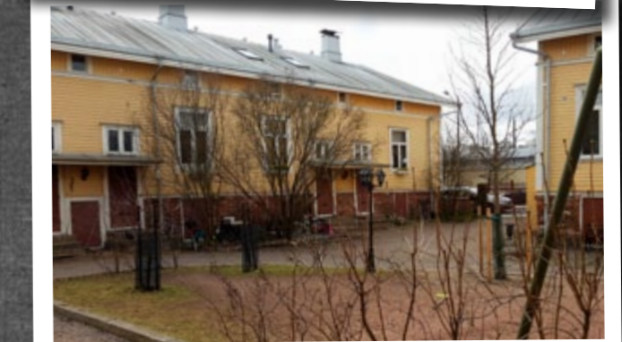
As Oy Ranta, keväällä 2016 Kuva Portsa Ry