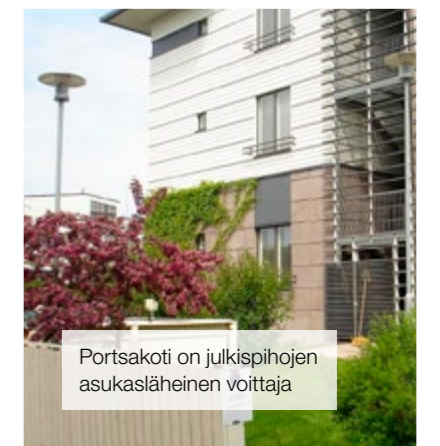
Portsakoti on julkispihojen asukasläheinen voittaja

Portsasta voimme ilmoittaa kilpailuun yhteensä kuusi pihaa. Portsa ry:n hallitus nimesi keskuudestaan alueraadin, joka valitsee sopivat ehdokkaat ja raportoi tuomaristolle. Sopivat pihat tulisi löytää kesäkuun loppuun mennessä ja voittajat ratkeavat marraskuun lopussa. Mikäli juuri teidän piha olisi mielestänne sopiva kilpailemaan kauneimman pihan tittelistä, ilmoittautukaa mukaan sähköpostilla info@portsa.fi , tai toukokuun katumarkkinoilla Portsa ry:n pisteellä. ■