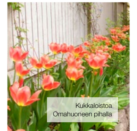
Kukkaloistoa Omahuoneen pihalla