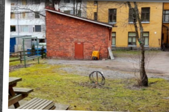
As Oy Kulmakivi, Sofiankatu 4 b, keväällä 2016